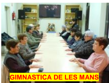
GIMNASTICA DE LES MANS