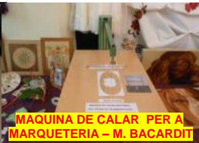
MAQUINA DE CALAR PER A MARQUETERIA – M. BACARDIT