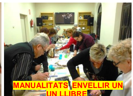
MANUALITATS ENVELLIR UN UN LLIBRE