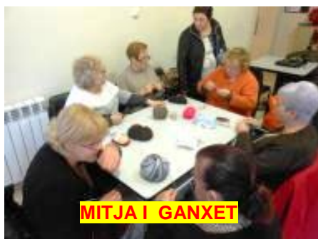
MITJA I GANXET