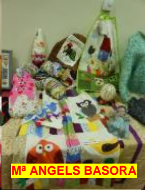
M a ANGELS BASORA