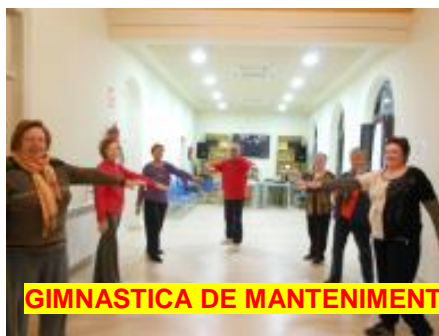
GIMNASTICA DE MANTENIMENT