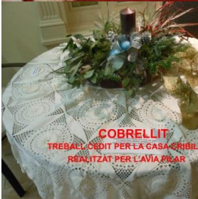
COBRELLIT TREBALL CEDIT PER LA CASA SIBILLERS. REALITZAT PER L'AVIA ENAR