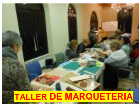
TALLER DE MARQUETERIA