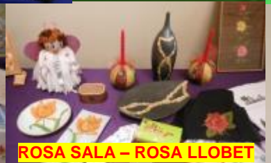
ROSA SALA - ROSA LLOBET