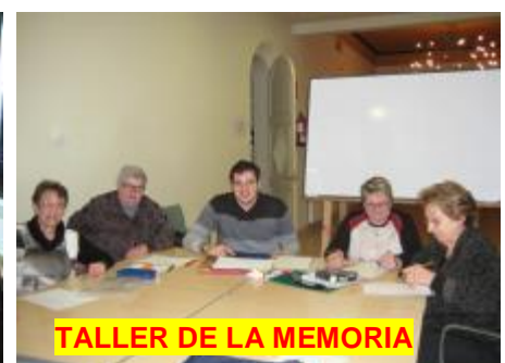
TALLER DE LA MEMORIA

La Junta de l'Esplai dona les gracies al nou Director de la Caixa, per la seva col-laboració i interès, amb vers la nostra entitat.