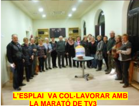
L'ESPLAI VA COL-LAVORAR AMB LA MARATÓ DE TV3

La 2a Mostra de Manualitats "Les aficions dels Calafins", fou un èxit de participació. 40 socis de la nostra entitat, han exposat a sala polivalent durant 5 dies les seves obres, donant-les a conèixer a tots els visitants que han vingut a veure la exposició. Gracies a tothom, a sigut un èxit de tots, però en especial per la la nostra entitat. L'Esplai va col·laborar amb la Marató de TV3 i es van recollir la quantitat de 165,89 €