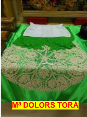
M a DOLORS TORÀ