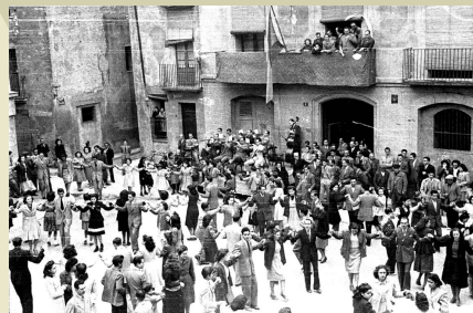
Ballada de sardanes a principis del segle xx.