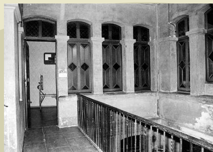
Replà de la planta primera.