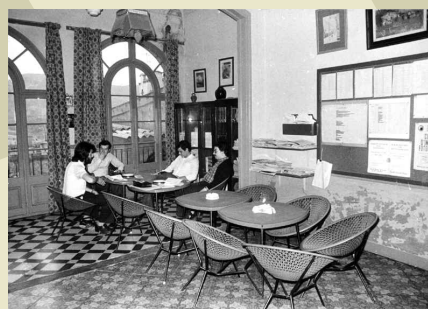
Antiga sala interior de l'agrupació fotogràfica.