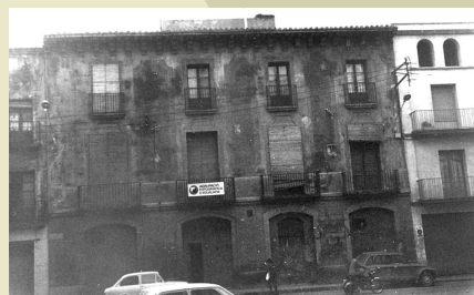
La façana a mitjans del segle passat.